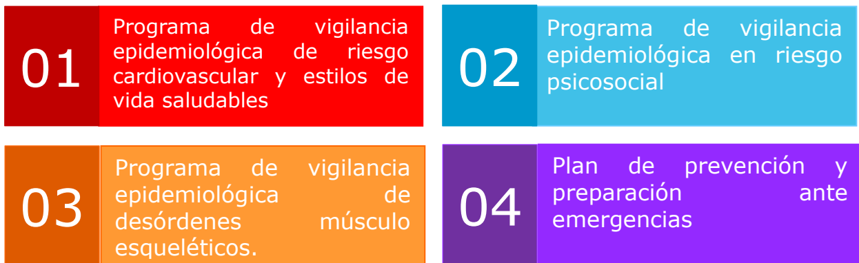
Ilustración 3. Planes y programas sistema de gestión de seguridad y salud en el trabajo

Los procesos de formación, instrucción y capacitación se dirigieron al desarrollo de capacidades, de la mano con la gestión del conocimiento y la innovación, orientando la educación con la investigación académica, articulando programas académicos especializados que soportan los requerimientos y las necesidades de la Entidad para responder efectivamente a las demandas y cambios múltiples del entorno institucional.