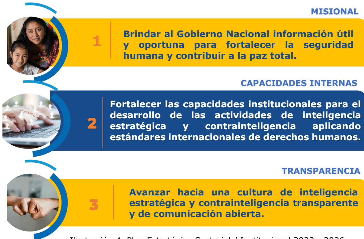
Ilustración 4. Plan Estratégico Sectorial / Institucional 2023 - 2026

Partiendo de las funciones encomendadas a la Dirección Nacional de Inteligencia a través del Decreto 4179 de 2011, la legislación aplicable para el desarrollo de actividades de inteligencia y contrainteligencia, los compromisos como Estado frente a los Objetivos de Desarrollo Sostenible, y los propósitos del Plan Nacional de Desarrollo 2022-2026 "Colombia potencia mundial de la vida", se definió el Plan Estratégico Sectorial / Institucional 2023-2026 "Inteligencia estratégica y contrainteligencia para consolidar la paz total y potencializar la vida", mediante el desarrollo de tres estrategias: